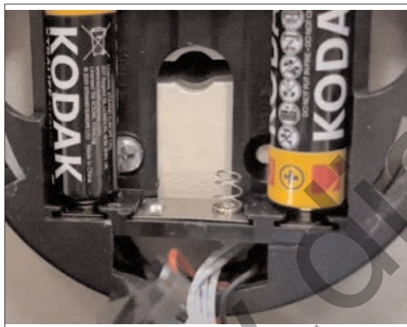
Βγάλτε τις 2 μεσαίες μπαταρίες ώστε να φανεί η τρύπα για το κλειδί.