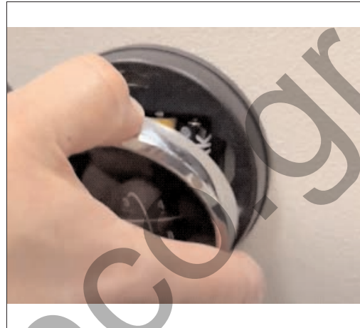
Ξεκουμπώστε το πληκτρολόγιο από τη θέση του ώστε να φανούν οι μπαταρίες.