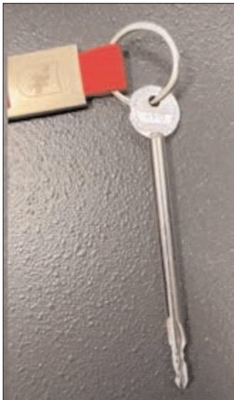
Κλειδί έκτακτης ανάγκης